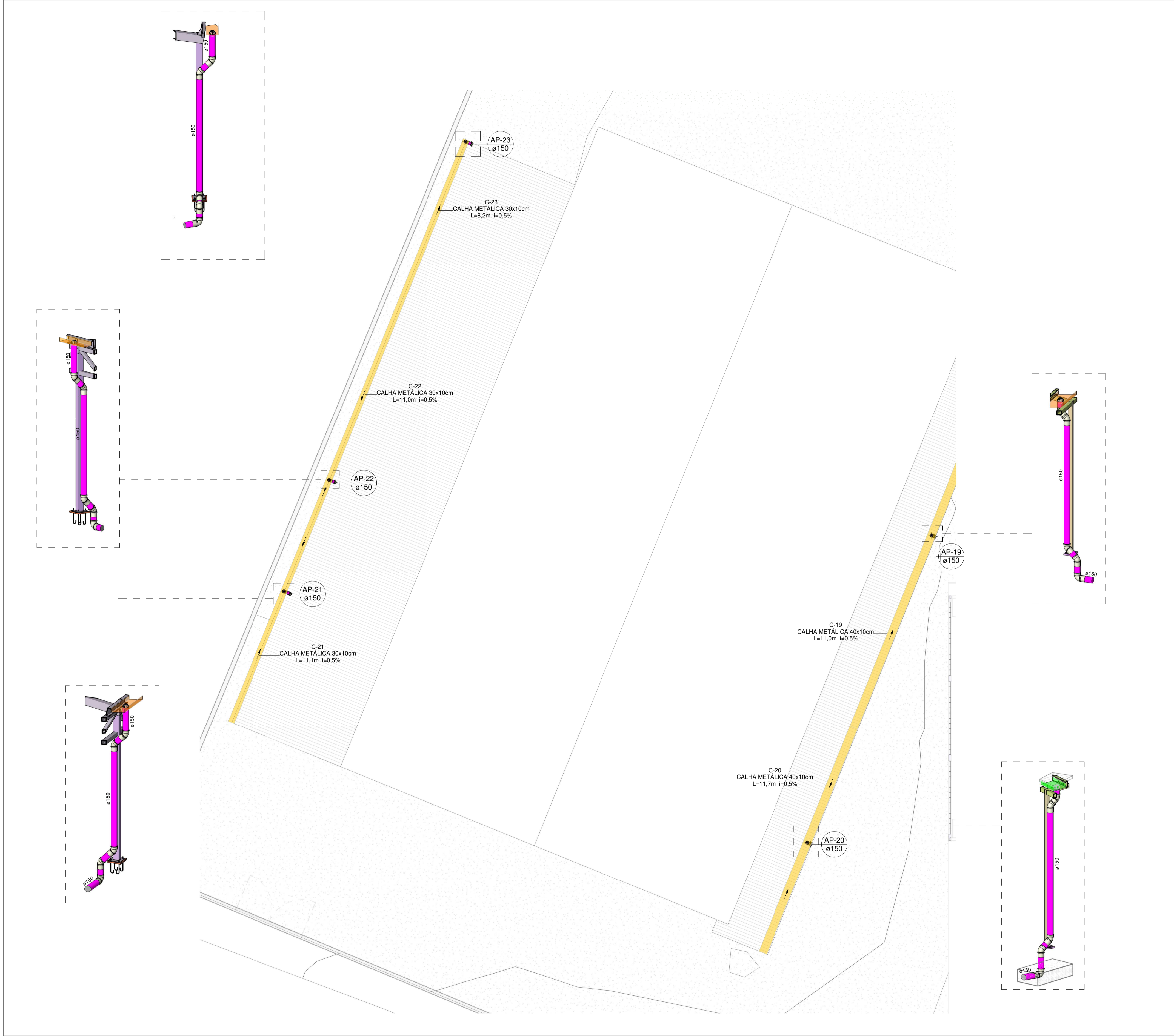
PLANTA BAIXA DRENAGEM PLUVIAL-COBERTURA (PARTE 03) Escala 1 : 100